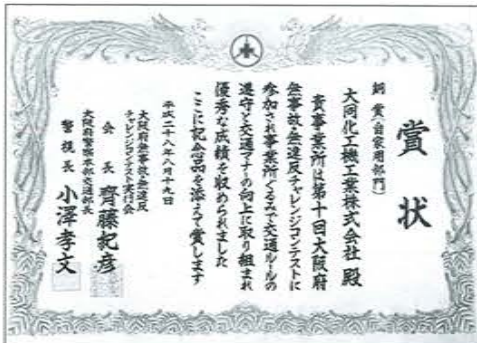
(写真2) 第10回 大阪府無事故・無違反チャレンジコンテストで銅賞を受賞している