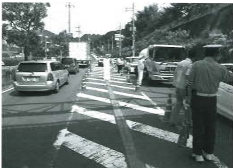
(写真3) シートベルト着用キャンペーンのようす